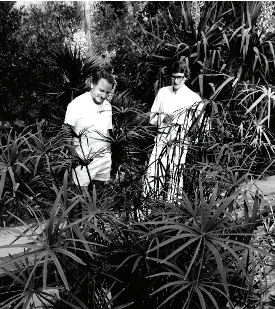
Pierre Bergé et Yves Saint Laurent, dar Es Saada, Marrakech, fin des années 1976