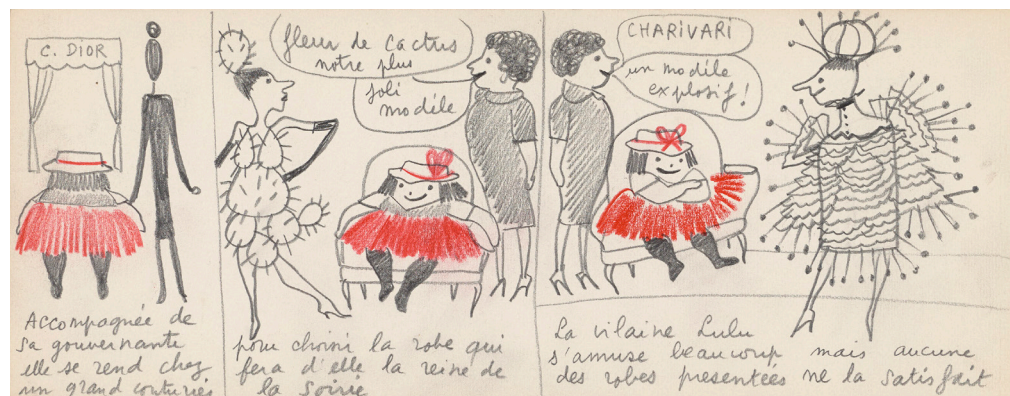
Yves Saint Laurent, croquis original pour La Vilaine Lulu , « Un choix difficile », 1956, crayon graphite et crayon de couleur sur papier, 12,5 x 32,5 cm, musée Yves Saint Laurent Paris

Le musée Yves Saint Laurent Paris conserve une grande partie des planches originales réalisées par Yves Saint Laurent. Un premier article sur La Vilaine Lulu est publié dans le magazine Vogue (Paris) en août 1964, puis deux versions de la bande dessinée sortent en 1967 à la maison d'édition Tchou, rééditée en 2003 pour finalement être publiée aux éditions de La Martinière en version courte en 2010. Une version étrangère a été publiée au Japon, aux éditions Kawade Shobo Shinsha en 2009.